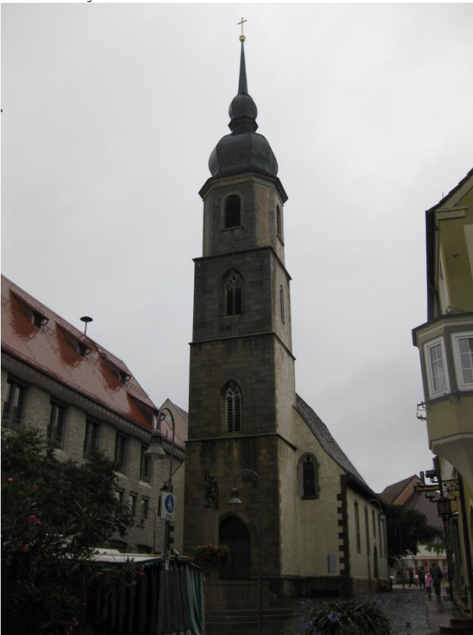
Liebfrauenkapelle Autor: Eva Vohburger