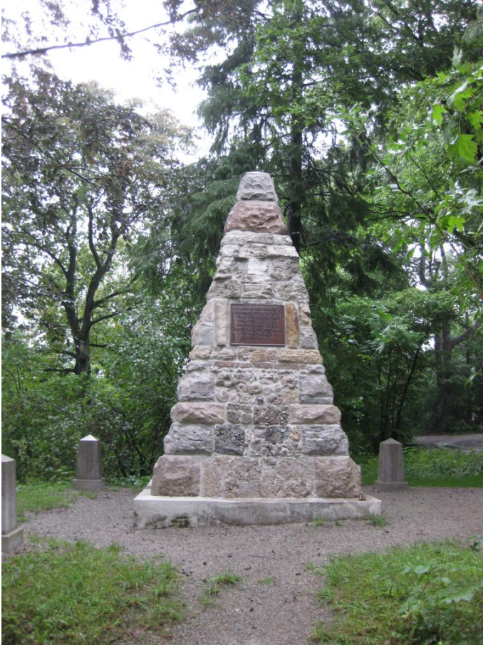
Steinpyramide Autor: Eva Vohburger