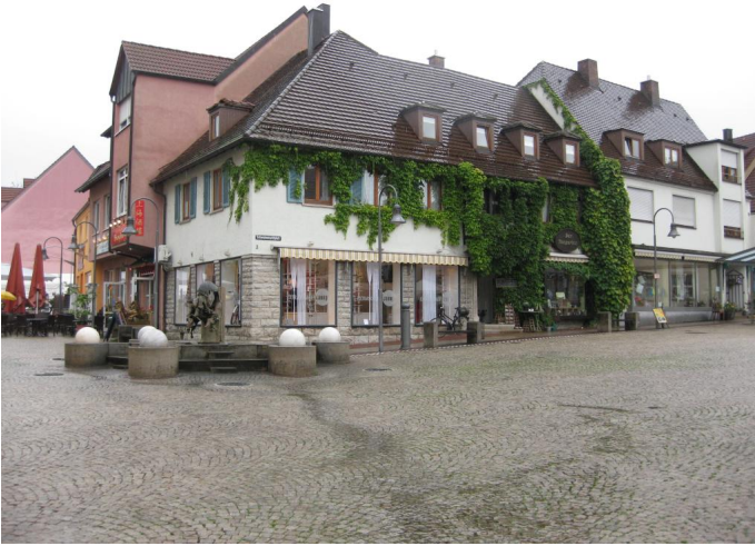
Schweinemarktplatz Autor: Eva Vohburger