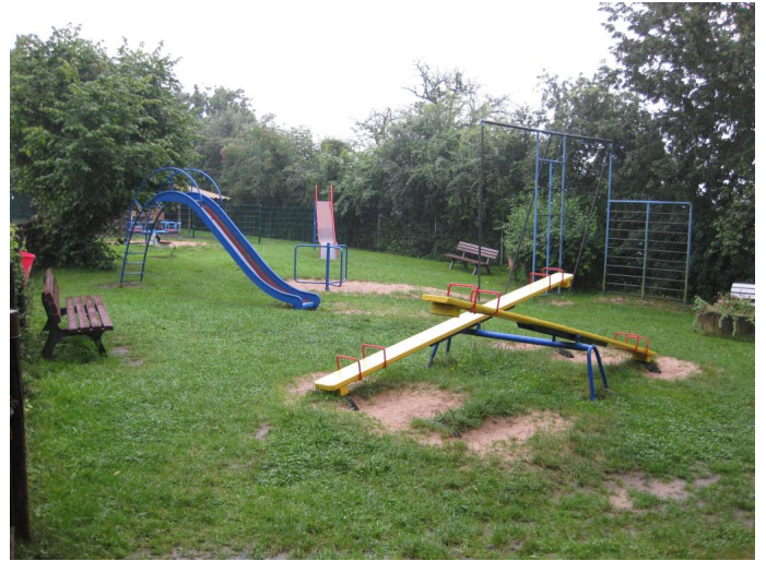
Spielplatz im Vogelpark