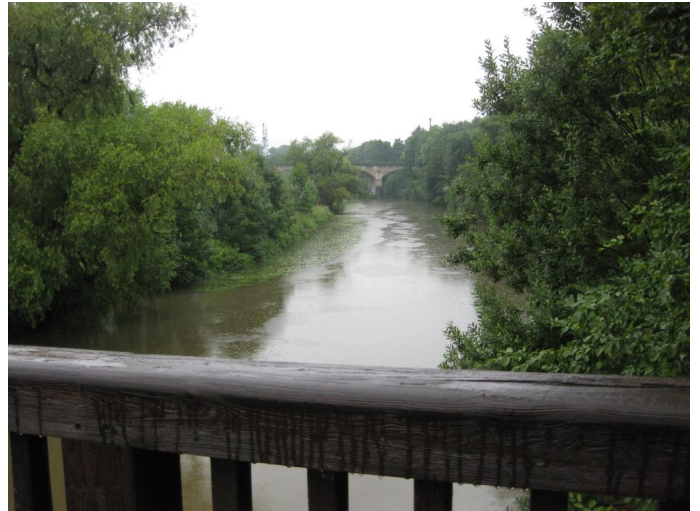
Ausblick vom Jagststeg über die Jagst