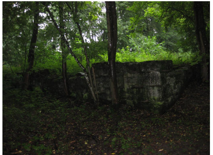
Ruine Autor: Eva Vohburger